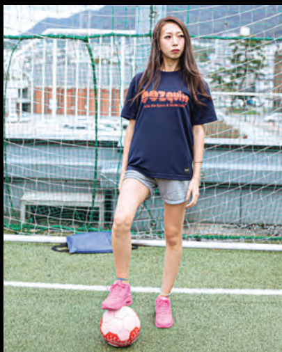
woman: 身長167cm Mサイズ着用