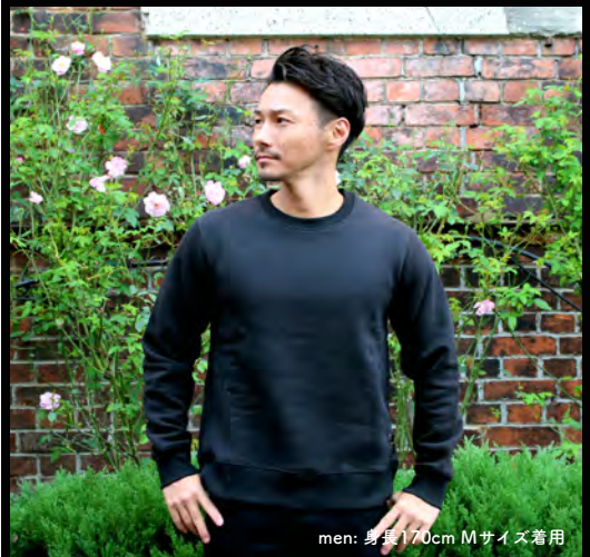
men: 身長170cm Mサイズ着用