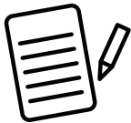
A. オーダーシートにご記入