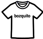
B. デザインのご提案